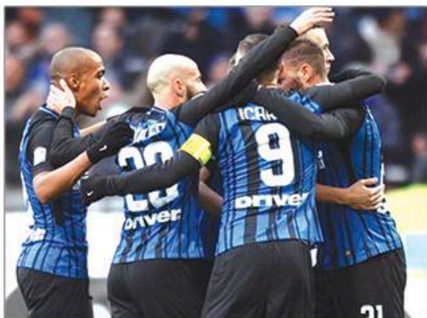
ဂျူဗင်တပ် - အင်တာမီလန်

အဆင့် ၃ နေရာရောက်ရှိနေတဲ့ ဂျူဗင်တပ်ဟာ လက်ရှိ ဖာတော့ ခံစစ်ပိုင်းက မာကျောနေပါတယ်။ နောက်ဆုံးကစားခဲ့တဲ့ ၄ ပွဲဆက် ရိုးမပေးထားရသလို တိုက်စစ်ကလည်း ကောင်းမွန်နေပါတယ်။ ပွဲစဉ် ၁၅ ပွဲကစားအပြီးမှာ ၄၁ ရိုးအထိ သွင်းယူနိုင်တဲ့ တိုက်စစ်ပိုင်းက ရိုးရရှိ စိတ်ပူစရာမရှိပါဘူး။ အမှတ်ပေးစယားကို ဦးဆောင်နေတဲ့ အင်တာမီလန်က ခံစစ်ပိုင်းမှာ အများတွေ့ရှိနေပေမယ့် တိုက်စစ်ပိုင်းက ထက်မြက်မှုရှိပါတယ်။ နောက်ဆုံး ၆ ပွဲဆက်တိုက် ရိုးသွင်းယူနိုင်ခဲ့သလို အဝေးကွင်းနောက်ဆုံး ၇ ပွဲမှာလည်း ၆ ပွဲအထိ ရိုးသွင်းယူနိုင်ခဲ့ပါတယ်။ ဒါပေမဲ့ အင်တာမီလန်ဟာ အဝေးကွင်းနောက်ဆုံး ၅ ပွဲမှာ ၄ ပွဲအထိ ရိုးပြန်ပေးထားရပါတယ်။ အမှတ်ပေးစယားထိပ်ပြန်ရောက်ဖို့ ဂျူဗင်တပ်အတွက် နိုင်ပွဲလိုနေတာကြောင့် အားကုန်ထုတ်လာမှာပါ။ အင်တာမီလန်ကလည်း ရလဒ်ကောင်းဖို့ ခြင်ဆင်လာလိမ့်မယ်။ ဂျူဗင်တပ်ကွင်းနောက်ဆုံး ၄ ကြိမ်မှာ တစ်ကြိမ်သာ ရိုးပေါ်ဖြစ်ခဲ့ပေမယ့် လက်ရှိခြေစွမ်းအရ ဒီတစ်ကြိမ်က ရိုးပေါ်ဖြစ်လာလိမ့်မယ်။