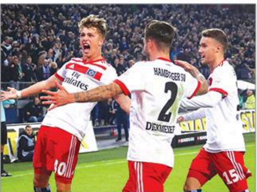
ဟမ်းဘတ် - ဂုမ်ဘတ်

ရိုးရဲလ်မက်ဒရစ်ဟာ ဒီရာသီမှာ ခြေစွမ်းပိုင်းက တည်ငြိမ်မှုမရှိသေးပါဘူး။ တိုက်စစ်က ထက်မြက်မှုရှိနေပေမယ့် ခံစစ်က အားနည်းချက်တွေများနေပြီး တိုက်စစ်ရိုးသွင်းယူသလောက် ခံစစ်က ရိုးပြန်ပေးနေရပါတယ်။ ဒါပေမဲ့ ရိုးရဲလ်မက်ဒရစ်ဟာ အိမ်ကွင်းမှာ နောက်ဆုံး ၇ ပွဲဆက် ရိုးသွင်းယူနိုင်ခဲ့သလို တစ်ပွဲပျမ်းမျှ ၂ ရိုးနှုန်း သွင်းယူနိုင်ခဲ့ပါတယ်။ ဆီဗီလာကလည်း ဒီရာသီမှာ ခြေစွမ်းပိုင်းကောင်းမွန်လာတဲ့ အသင်းပါ။ အထူးသဖြင့် တိုက်စစ်ပိုင်းက ပွဲတိုင်းနီးပါး ရိုးသွင်းနိုင်ခြင်းဖြစ်ပါတယ်။ ဆီဗီလာဟာ အဝေးကွင်းနောက်ဆုံး ၆ ပွဲမှာလည်း ၅ ပွဲအထိ ရိုးသွင်းယူနိုင်ခဲ့ပေမယ့် အဝေးကွင်းနောက်ဆုံး ၈ ပွဲမှာတော့ ၇ ပွဲအထိ ရိုးပေးထားရပါတယ်။ ဒီ ၂ သင်းဟာ နောက်ဆုံးတွေ့ဆုံတဲ့ ၉ ကြိမ်စလုံး ရိုးအပေါ်ပွဲတွေသာ ထွက်ပေါ်ထားပြီး ရိုးရဲလ်မက်ဒရစ်ကွင်းမှာတွေ့ခဲ့တဲ့ နောက်ဆုံး ၇ ကြိမ်မှာလည်း ရိုးပေါ်ပွဲတွေသာ ထွက်ပေါ်ထားပါတယ်။ ၂ သင်းစလုံးရဲ့ ခံစစ်အားနည်းမှုတွေကြောင့် ရိုးအပေါ်ပွဲသာ ထွက်ပေါ်လာလိမ့်မယ်။