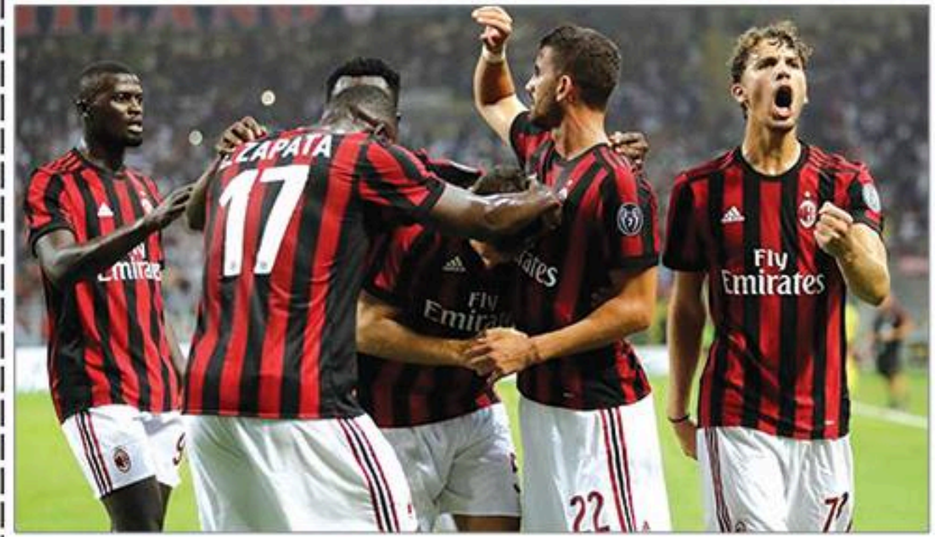
အေစီမီလန် - ဘိုလော့ဂ်နာ ၁၀-၁၂-၁၇ (တနင်္ဂနွေနေ့ - ၂:၁၅ နာရီ) အာရှဈေးကွက်ဖွင့်လှစ်မှု (၂-၇)

အေစီမီလန်ဟာ ပွဲဆက်တွေ များလာတာနဲ့အမျှ ခြေစွမ်းပိုင်းက တည်ငြိမ်မှုကျဆင်းလာခဲ့ပြီး ရလဒ်တွေလည်း ဆိုးရွားလာခဲ့ပါတယ်။ နောက်ဆုံးကစားခဲ့တဲ့ ၄ ပွဲမှာ တစ်ပွဲသာ အနိုင်ရထားတဲ့ အေစီမီလန်ဟာ နည်းပြသစ် ဂတ်တူဆိုလက်ထက်မှာလည်း သရေပွဲတွေသာ ကြုံထားပါတယ်။ အေစီမီလန်ဟာ တိုက်စစ်က ၂၁ ဂိုးအထိ သွင်းနိုင်ခဲ့ပေမယ့် ဂိုး ၂၀ အထိ ပြန်ပေးထားရပါတယ်။ အိမ်ကွင်းနောက်ဆုံး ၆ ပွဲမှာ တစ်ပွဲသာ ဂိုးသွင်းနိုင်ခဲ့တဲ့ တိုက်စစ်ပိုင်းအရ အားနည်းတဲ့ များနေတယ်လို့ သတ်မှတ်ရမှာပါ။ ဘိုလော့ဂ်နာကတော့ နောက်ပိုင်းပွဲတွေမှာ ခြေ