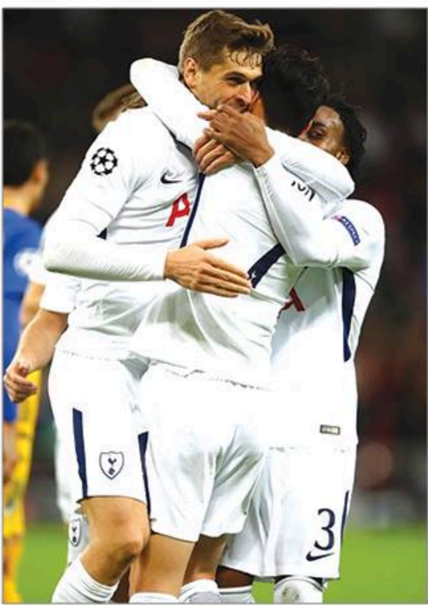
ပြီးခဲ့သည့်အပတ်ရွေးချယ်မှု၏ မှန်/မှားအနေအထား