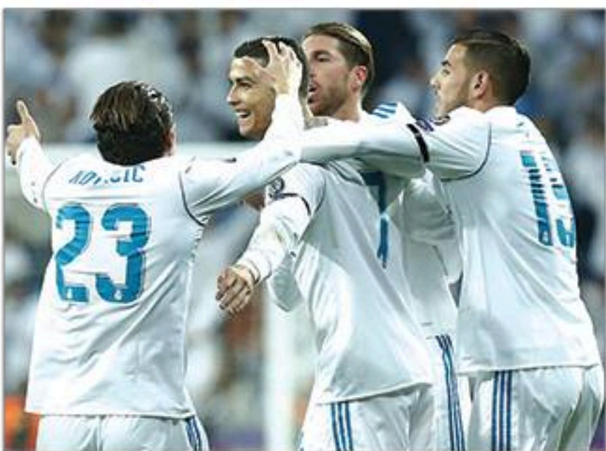
ရိုးရဲလ်မက်ဒရစ် - ဆီဗီလာ

အဆင့် ၃ နေရာရောက်ရှိနေတဲ့ ဂျူဗင်တပ်ဟာ လက်ရှိ ဖာတော့ ခံစစ်ပိုင်းက မာကျောနေပါတယ်။ နောက်ဆုံးကစားခဲ့တဲ့ ၄ ပွဲဆက် ရိုးမပေးထားရသလို တိုက်စစ်ကလည်း ကောင်းမွန်နေပါတယ်။ ပွဲစဉ် ၁၅ ပွဲကစားအပြီးမှာ ၄၁ ရိုးအထိ သွင်းယူနိုင်တဲ့ တိုက်စစ်ပိုင်းက ရိုးရရှိ စိတ်ပူစရာမရှိပါဘူး။ အမှတ်ပေးစယားကို ဦးဆောင်နေတဲ့ အင်တာမီလန်က ခံစစ်ပိုင်းမှာ အများတွေ့ရှိနေပေမယ့် တိုက်စစ်ပိုင်းက ထက်မြက်မှုရှိပါတယ်။ နောက်ဆုံး ၆ ပွဲဆက်တိုက် ရိုးသွင်းယူနိုင်ခဲ့သလို အဝေးကွင်းနောက်ဆုံး ၇ ပွဲမှာလည်း ၆ ပွဲအထိ ရိုးသွင်းယူနိုင်ခဲ့ပါတယ်။ ဒါပေမဲ့ အင်တာမီလန်ဟာ အဝေးကွင်းနောက်ဆုံး ၅ ပွဲမှာ ၄ ပွဲအထိ ရိုးပြန်ပေးထားရပါတယ်။ အမှတ်ပေးစယားထိပ်ပြန်ရောက်ဖို့ ဂျူဗင်တပ်အတွက် နိုင်ပွဲလိုနေတာကြောင့် အားကုန်ထုတ်လာမှာပါ။ အင်တာမီလန်ကလည်း ရလဒ်ကောင်းဖို့ ခြင်ဆင်လာလိမ့်မယ်။ ဂျူဗင်တပ်ကွင်းနောက်ဆုံး ၄ ကြိမ်မှာ တစ်ကြိမ်သာ ရိုးပေါ်ဖြစ်ခဲ့ပေမယ့် လက်ရှိခြေစွမ်းအရ ဒီတစ်ကြိမ်က ရိုးပေါ်ဖြစ်လာလိမ့်မယ်။