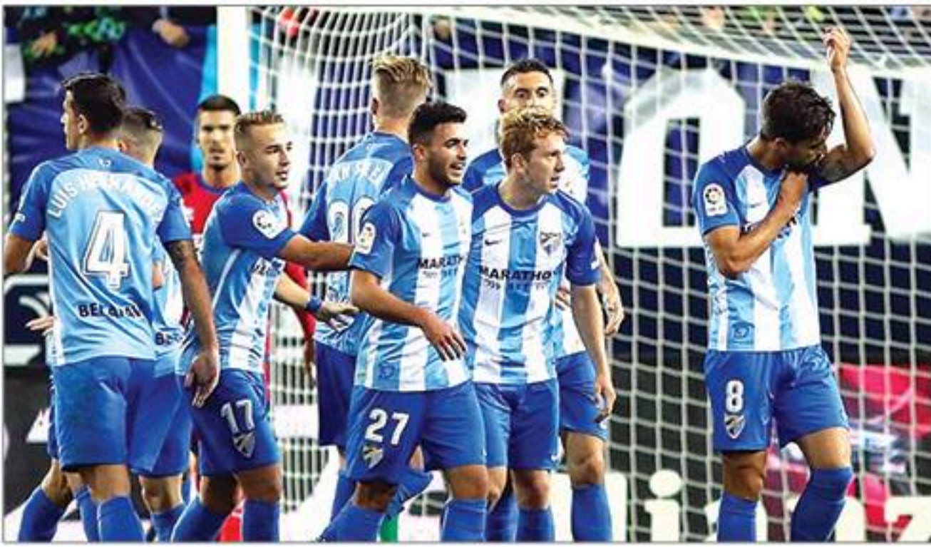
ဆိုစီဒက် - မာလာဂါ ၁၀-၁၂-၁၇ (တနင်္ဂနွေနေ့ - ၅:၃၀ နာရီ) အာရှဈေးကွက်ဖွင့်လှစ်မှု (ဆိုစီဒက် ၁-၁၅)

ဆိုစီဒက်က လက်ရှိမှာ အိမ်ကွင်းခြေစွမ်းပိုင်း မာပေမယ့် ခံစစ်စွမ်းဆောင်ရည် အနည်းငယ်ကျဆင်းနေတယ်လို့ သတ်မှတ်နိုင်ပါတယ်။ သူတို့ဟာ ပွဲစဉ် ၁၄ ပွဲအပြီးမှာ အဆင့် ၉ နေရာကို ရောက်နေတဲ့ အသင်းလည်းဖြစ်ပါတယ်။ အိမ်ကွင်းပွဲစဉ်တွေအတွင်း သွင်းဂိုး ၁၆ ဂိုး ရရှိထားပြီး ကစားကွက်က ၁၁ ဂိုး တည်ကန်ဘောတွေကနေ ၅ ဂိုးအထိ ရရှိခဲ့တာဖြစ်ပါတယ်။ အိမ်ကွင်းပေးဂိုးကတော့ ၁၄ ဂိုးရှိနေပြီး ကစားကွက်က ၁၁ ဂိုး၊ တည်ကန်ဘော၊ တန်ပြန်တိုက်စစ်နဲ့ ကိုယ့်ဂိုးကိုယ်သွင်းယူမှုတွေကနေ တစ်ဂိုးစီပေးထားရပါတယ်။