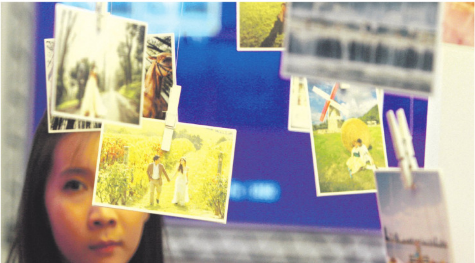
Jakarta Wedding Festival Pengunjung mengamati foto pernikahan yang dipromosikan di Jakarta Wedding Festival ke-11, di Jakarta Convention Center, Jakarta, Jumat (22/8). Ajang yang menyediakan informasi dan perencanaan pernikahan serta menampilkan koleksi busana, aksesoris, paket bulan-madu pascapernikahan ini, dapat dikunjungi hingga 24 Agustus mendatang.

piji diperkirakan mencapai keekonomian sebesar Rp11.944 per kg atau sampai konsumen Rp180.000 per tabung. Pertamina menghitung tanpa kenaikan elpiji maka bisnis elpiji 12 kg bakal mengalami kerugian mendekati Rp6 triliun pada 2014. ■ Timur Arif/Antara