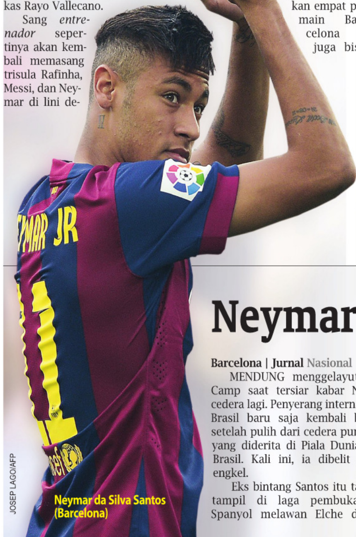
Neymar da Silva Santos (Barcelona)