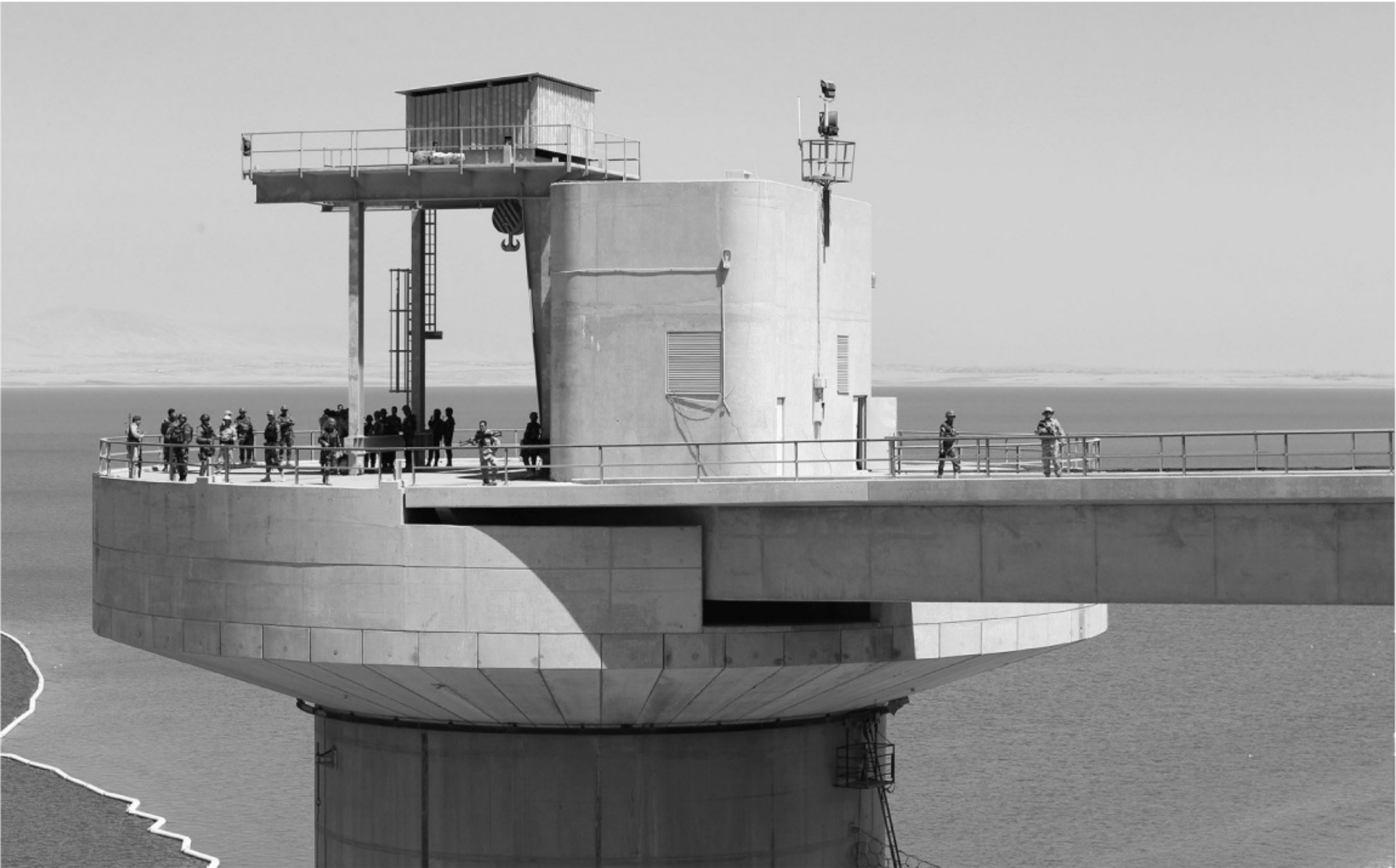
Mempertahankan Bendungan Para pejuang Peshmerga berjaga di bendungan terbesar di Irak utara, Bendungan Mosul, pada Kamis, (21/8). Siapa yang mengendalikan bendungan, dia-lah yang mengendalikan kota. Dengan asumsi itu, pemberontak IS merebut bendungan dari pasukan Kurdi pekan lalu.

ruh wilayah tersebut di tangan orang-orang itu, yang tak memiliki belas kasihan”, tambah Ketua Interpol tersebut. Kepala Interpol itu kembali menyoroti perlunya bagi tanggapan banyak pihak terhadap ancaman teror yang ditimbulkan oleh petempur fanatik trans-nasional yang datang ke daerah konflik di Timur Tengah, kata Xinhua, yang dipantau Antara di Jakarta, Jumat pagi. Satu rekaman video yang disiarkan pada Selasa (19/8) memperlihatkan seseorang yang berkedok dari kelompok Negara Islam memenggal kepala James Foley, seorang wartawan lepas, untuk membalas serangan udara yang dilancarkan AS terhadap sasaran kelompok itu. ■