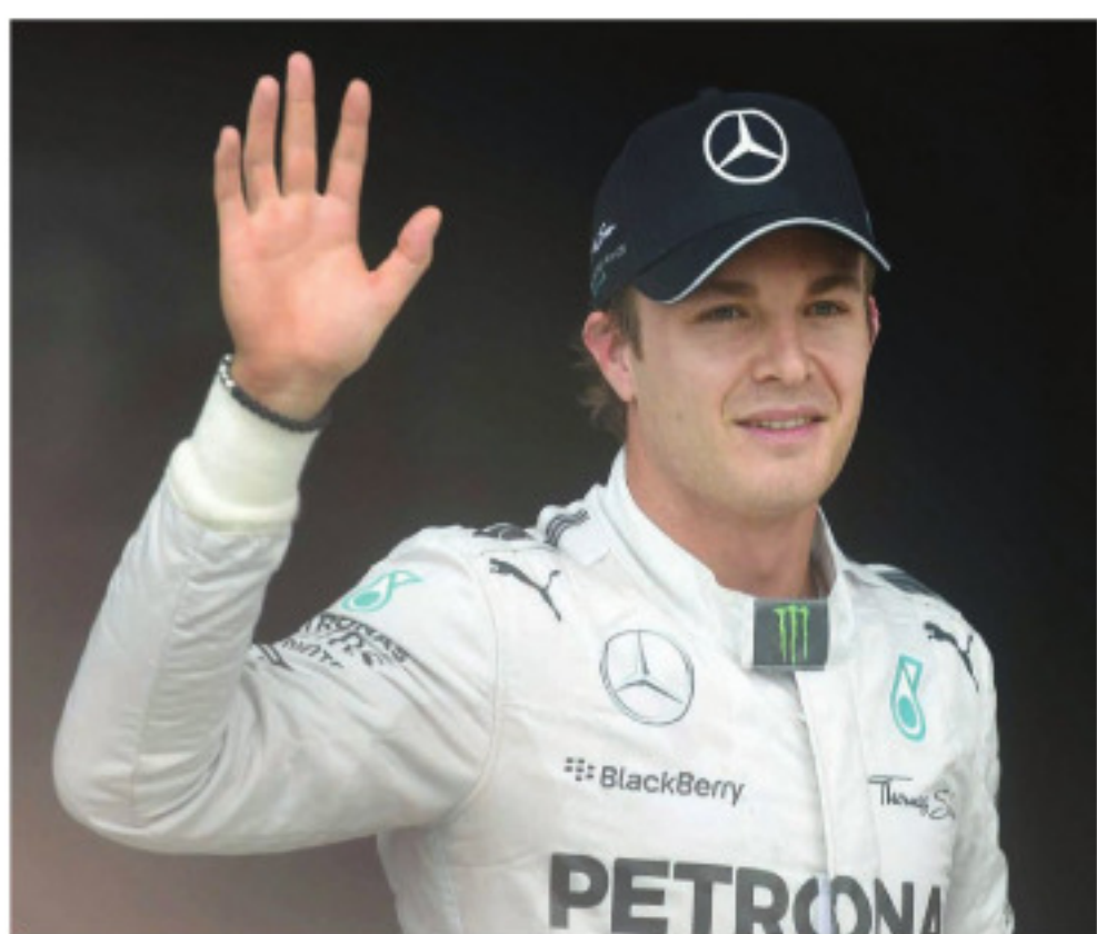
Nico Rosberg (Mercedes)