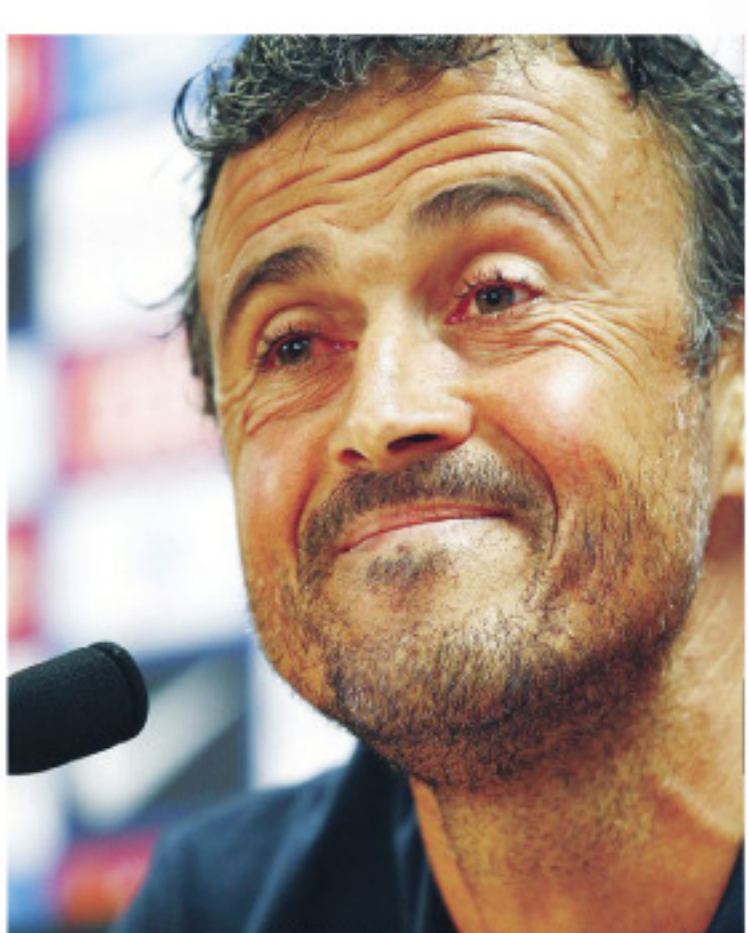
Luis Enrique Martinez (Pelatih Barcelona)