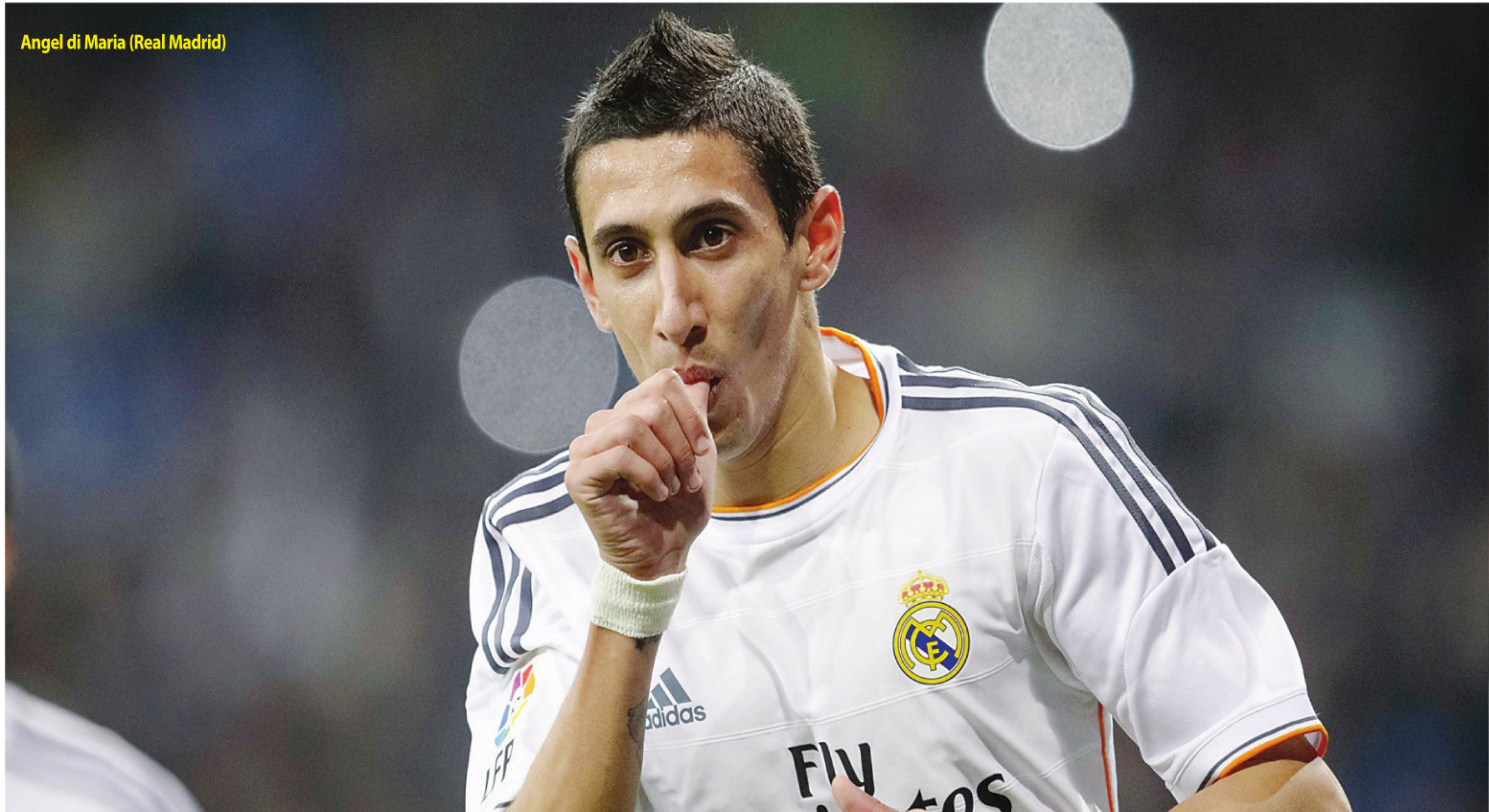
Angel di Maria (Real Madrid)