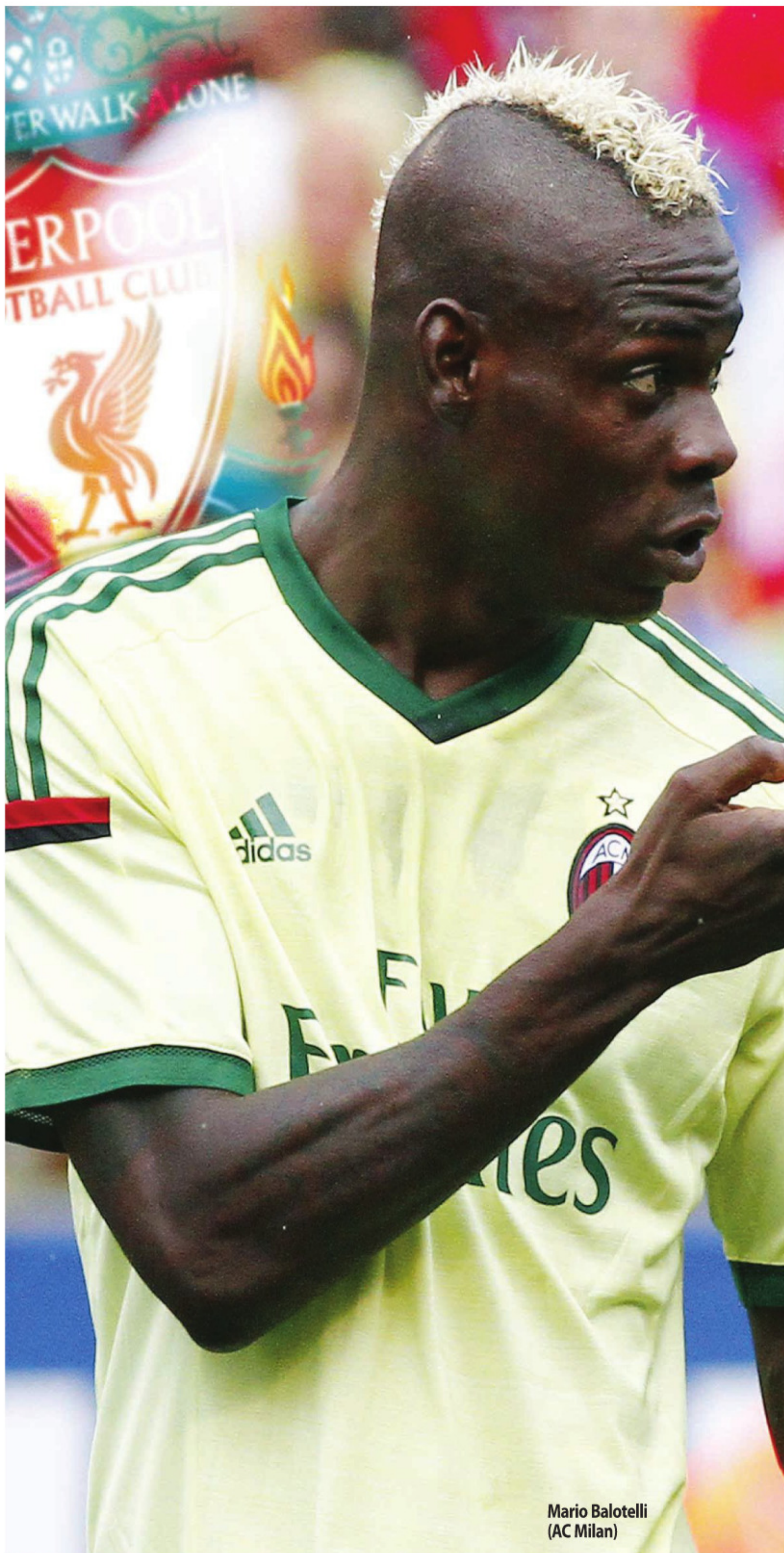
Mario Balotelli (AC Milan)