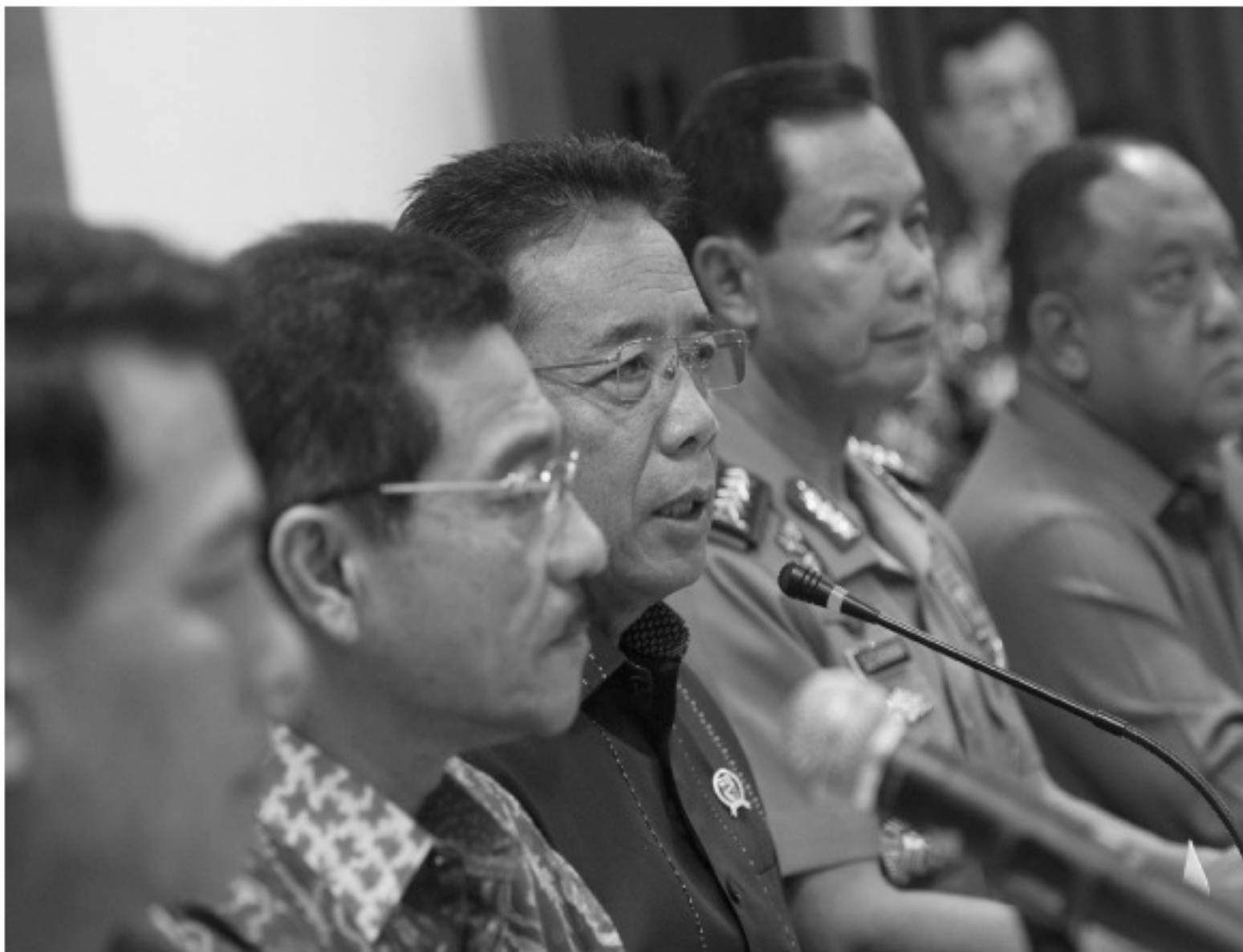
Evaluasi Pengamanan Pilpres Menko Polhukam Djoko Suyanto (tengah) didampingi Mendagri Gamawan Fauzi (kedua kiri), Panglima TNI Jenderal TNI Moeldoko (kiri), Kapolri Jenderal Pol Sutarmaji (kedua kanan) dan Kepala BIN Letjen TNI (Purn) Marciano Norman memberi keterangan kepada pers usai rapat evaluasi Pengamanan Pilpres di Kantor Kemenko Polhukam Jakarta, Jumat (22/8). Menurut Djoko Suyanto pascaputusan MK terkait perselisihan Pilpres, kondisi dan situasi keamanan di seluruh Indonesia aman dan kondusif.