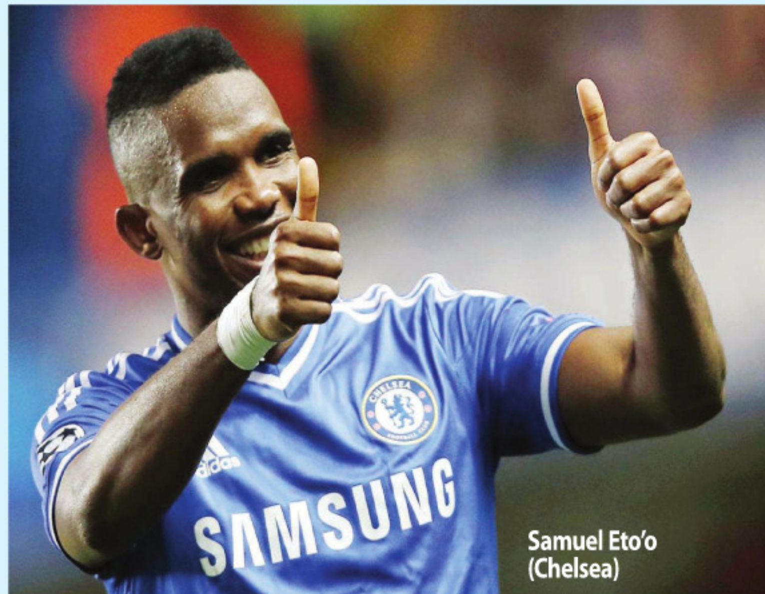
Samuel Eto'o (Chelsea)

Golnya mengirim Der Panzer , yang berstatus favorit di ajang tersebut, masuk kotak. Italia pun lolos ke final menghadapi juara bertahan Spanyol. Balotelli memang fenomena untuk Italia dan dunia. ■