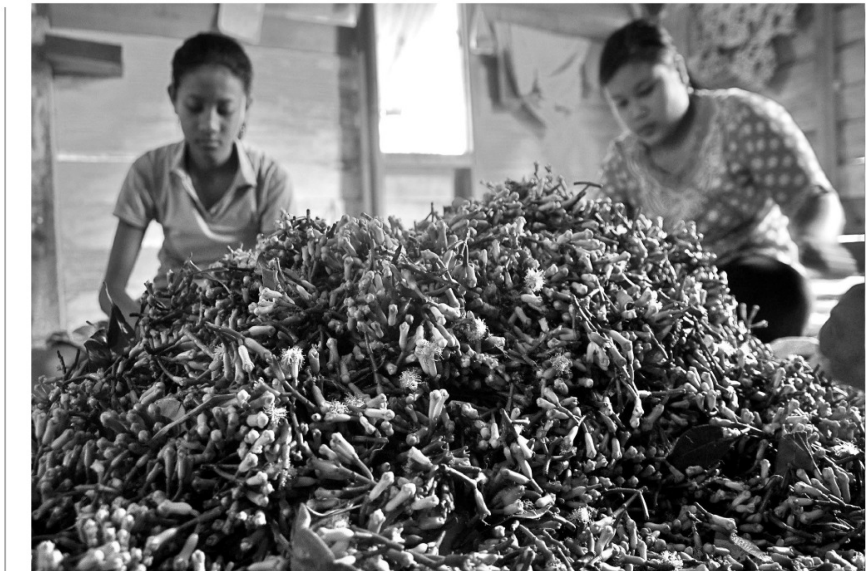
Buruh Pritil Cengek Buruh memisahkan buah cengek dari tangkainya di areal perkebunan cengek Desa Ngadiwongso, Sukorejo, Kendal, Jawa Tengah, Jumat (22/8). Untuk pekerjaan itu buruh mendapatkan upah Rp600 per kilogram cengek, dalam sehari seorang buruh mampu memisahkan cengek antara 10-12 kilogram cengek.

Sedangkan, pola pastoral semi intensif dibutuhkan untuk mengakselerasi pemanfaatan lahan-lahan padang penggembalaan sapi sebagaimana yang telah di-