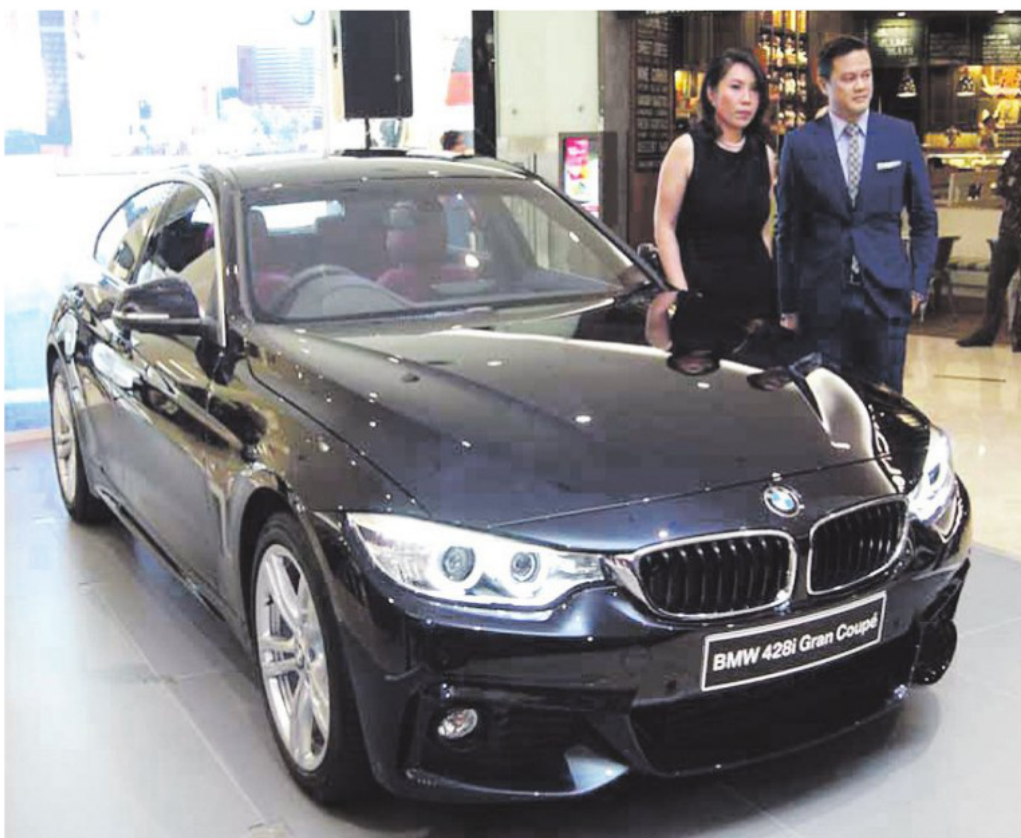
BMW 428i Convertible

Bahkan di pasar Indonesia, PT TMI mengincar 10 persen pangsa pasar dari perkiraan market sebesar 3.500-4.000 unit per tahun, "Jumlah perkiraan pasar tepatnya memang susah ditebak, karena banyak yang masuk di jalur tidak resmi, atau bahkan importir umum. Tapi kira-kira di angka tersebut (4.500-5.000 unit setahun)," ujar Paulus. ■