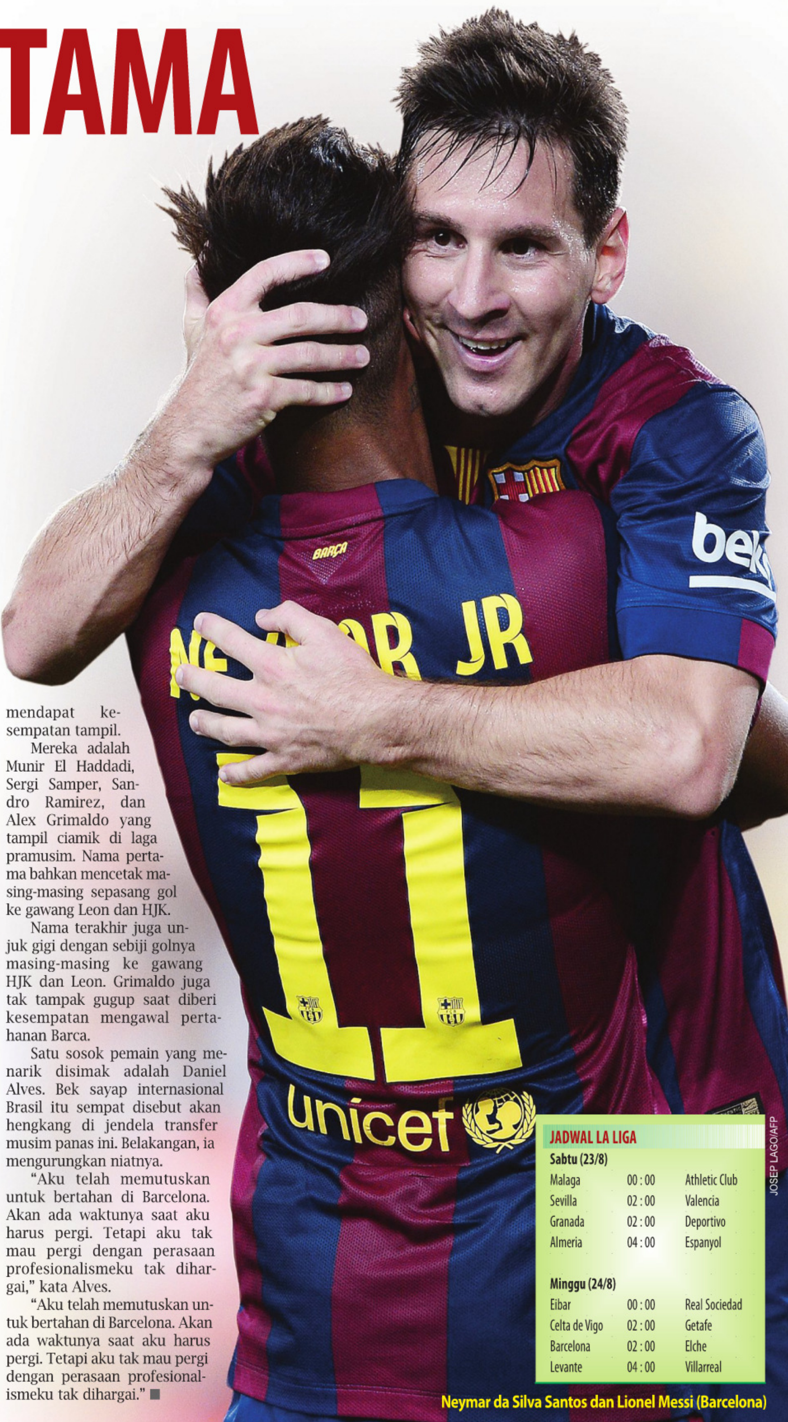
Neymar da Silva Santos dan Lionel Messi (Barcelona)

pan. Ketiganya akan ditopang gelandang jenius Andres Iniesta, Sergio Busquets, dan Ivan Rakitic. Kemenangan fantastis atas HJK dan Leon, masing-masing 6-0, menambah percaya diri Los Cules memasuki musim 2014-15. Elche sepertinya harus siap menjadi bulan-bulanan barisan serang Raksasa Katalan. Enrique hanya tak bisa menurunkan Pedro yang terkena diare, Marc-Andre ter Stegen dan Thomas Vermaelen juga tengah menjalani pemulihan cedera. Jika dibutuhkan empat pemain Barcelona B juga bisa mendapat kesempatan tampil. Mereka adalah Munir El Haddadi, Sergi Samper, Sandro Ramirez, dan Alex Grimaldo yang tampil ciamik di laga pramusim. Nama pertama bahkan mencetak masing-masing sepasang gol ke gawang Leon dan HJK. Nama terakhir juga unjuk gigi dengan sebiji golnya masing-masing ke gawang HJK dan Leon. Grimaldo juga tak tampak gugup saat diberi kesempatan mengawal pertahanan Barca. Satu sosok pemain yang menarik disimak adalah Daniel Alves. Bek sayap internasional Brasil itu sempat disebut akan hengkang di jendela transfer musim panas ini. Belakangan, ia mengurungkan niatnya. "Aku telah memutuskan untuk bertahan di Barcelona. Akan ada waktunya saat aku harus pergi. Tetapi aku tak mau pergi dengan perasaan profesionalismeku tak dihargai," kata Alves. "Aku telah memutuskan untuk bertahan di Barcelona. Akan ada waktunya saat aku harus pergi. Tetapi aku tak mau pergi dengan perasaan profesionalismeku tak dihargai." ■