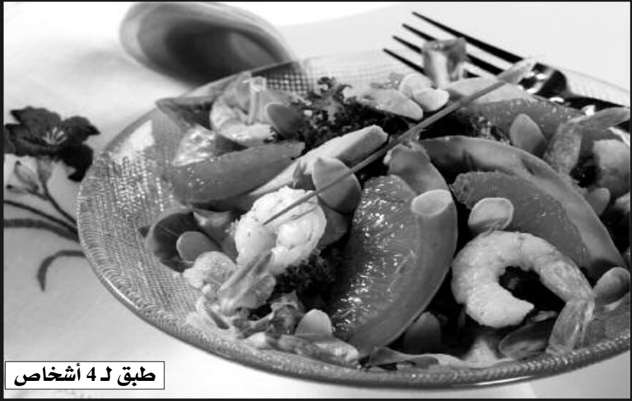
طبق لـ 4 أشخاص

بالإضافة إلى اللوز المقطع ناعماً، مع المعمر "etteluobic".