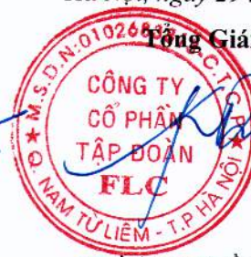
HƯƠNG TRẦN KIỀU DUNG