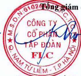
HƯƠNG TRẦN KIỀU DUNG