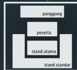
Denah Dalam Balairung UI

Stand berada di dalam Balairung UI, di bagian pinggir, mengelilingi area talkshow.