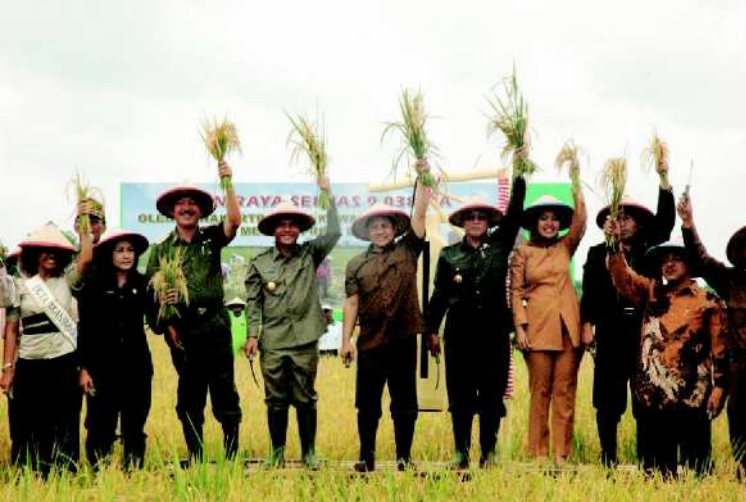
■ Menakertrans Muhaimin Iskandar mengikuti pembukaan panen raya padi di KTM Mesuji, Lampung.

Transmigrasi model KTM yang sudah dilaksanakan, tidak hanya turut mendorong pertumbuhan ekonomi baru daerah melainkan sudah banyak yang berkembang menjadi pusat administrasi pemerintahan dalam bentuk kota dan kabupaten. Seandainya ada delapan kabupa-