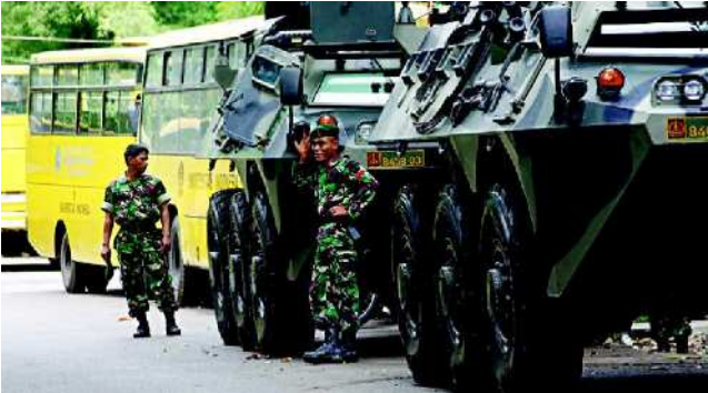
TNI DI UI: Pasukan TNI berjaga-jaga di Kampus UI, kemarin. Hal ini dilakukan untuk menyambut kedatangan Presiden AS Barack Obama.