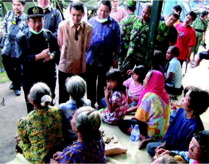
Wakil Ketua DPR RI, Priyo Budisantoso bersama dengan Pimpinan Komisi VIII DPR RI dan Anggota DPR RI dari Daerah Pemilihan Yogyakarta-Jawa Tengah (37 orang) mengunjungi pengungsi korban Merapi. Rombongan juga menbesuk korban di RS, Dr. Sarjito,

Priyo mengharapkan, dana darurat tersebut dapat dipergunakan secara maksimal mungkin