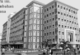
Kampus UIN Jakarta.