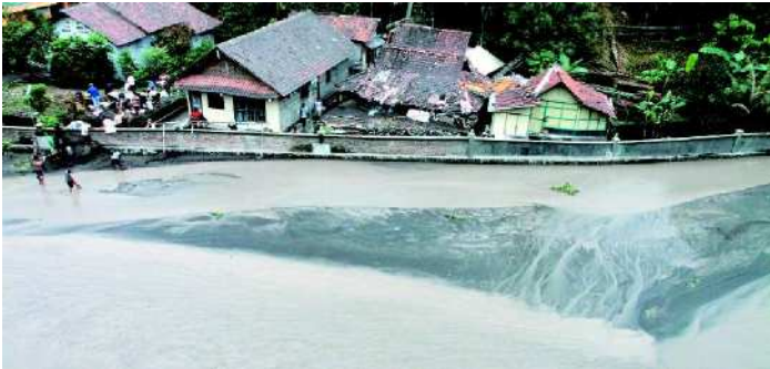
RAWAN BANJIR: Pasir Merapi membentuk delta di tengah Sungai Code, Yogyakarta, kemarin. Ini membuat sungai ini rawan banjir. Terutama dari kemungkinan lahar dingin Merapi.

kemarin. Tanda bahwa aktivitas gunung masih tinggi, terlihat dalam sinyal grafik yang diperlihatkan alat pemantau Merapi di kantor BPPTK atau Balai Penyelidikan dan Pengembangan Teknologi Kegunungpian. Kemarin, alat itu terus mencatat grafik naik turun, membentuk sudut-sudut