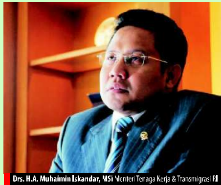
Dr. H.A. Muhaimin Iskandar, Menteri Tenaga Kerja & Transmigrasi RI

Letak geografis Indonesia yang terletak di cincin api, membuat rentan terjadi bencana alam, seperti gempa bumi, tsunami dan tanah longsor.