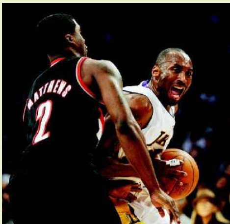
Kobe Bryant (kanan)

Tapi, kami punya rencana pertarungan dan dengan rencana itu kami akan mengalahkan Manny. Saya akan melontarkan pukulan secara konstan dan tidak pernah berhenti memberi tekanan," ujar Margarito beberapa waktu lalu. ■ NOV