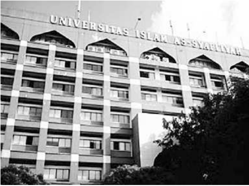
Kampus UIA di Jakarta.

UNTUK membangun perekonomian nasional, pengusaha properti yang juga berkiprah di bidang pendidikan, Ciputra, mengharapkan perguruan tinggi bisa menjadi penggerak wirausaha alias entrepreneurship di tanah air. Harapan itu disampaikan Ciputra di sela-sela kuliah umum kewirausahaan di Universitas Islam As-syafiyah (UIA), Jatiwarungin, Pondok Gede, Jakarta. Menurut Ciputra, UIA seharusnya jadi pelopor menggerakkan wirausaha di kalangan perguruan tinggi Islam maupun kalangan