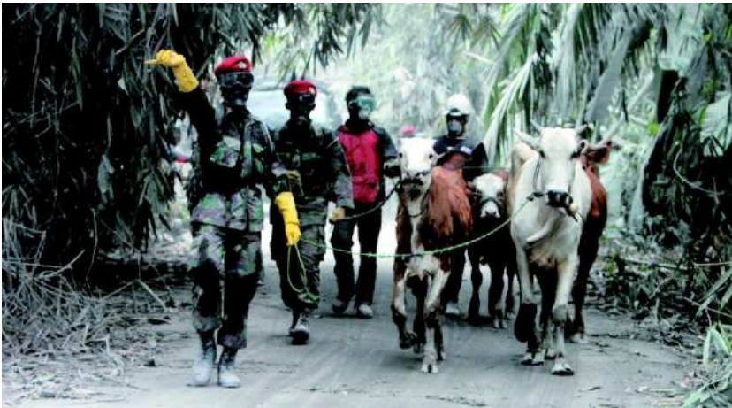
TARIK TERNAK: Berseragam lengkap, plus masker gas, Pasukan Kopassus bersama PMI dan relawan melakukan evakuasi di Dusun Ngancar, Glagah Harjo, Sleman, kemarin. Mereka berhasil menemukan 3 jenazah. 8 ekor sapi dan 1 ekor kambing.

Karena tak diajak dalam rombongan Presiden SBY ngantor di Yogyakarta, kabarnya, ada menteri yang kecewa. Bahkan, si menteri sudah bicara ke teman-temannya di partai soal kemungkinan dia diepak dari kabinet.